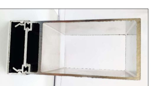
DETALHE PERFIL VERTICAL

IMAGEM ILUSTRATIVA A imagem ilustra a Parede de Vidro para o Novo Centro Administrativo de Travesseiro, apresentando a configuração dos painéis e a localização das portas de abertura. A escala é 1:50. A-14 - Devido ser conteúdos as medidas para o fornecimento e instalação, em caso de dúvidas referente ao projeto, contatar o setor de engenharia da Prefeitura Municipal.